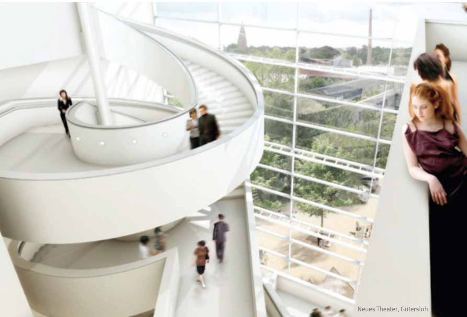
Neues Theater, Gütersloh

Die MODUS Consult AG hat ihren Hauptsitz in Gütersloh und befindet sich damit in guter Gesellschaft starker Marken. Global Player wie Miele, Bertelsmann oder Nobilia finden hier beste Bedingungen für ihren unternehmerischen Erfolg. Und wen der Job einmal nach Gütersloh gezogen hat, der fühlt sich schnell rundum wohl. Denn in der attraktiven Einkaufsstadt stimmt die Lebensqualität: Breit gefächerte Freizeitaktivitäten mit Kunst, Kultur und Sport, umfassende Bildungsangebote, viel Natur und eine familienfreundliche Umgebung machen Gütersloh so liebens- und lebenswert.